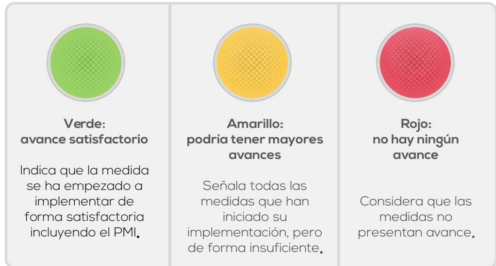
Figura 1. Semáforo de la implementación de las medidas de género en el AP

Al desarrollo normativo y al desarrollo operativo de cada medida se le asignan los colores del semáforo según los criterios expuestos en la Figura 1.